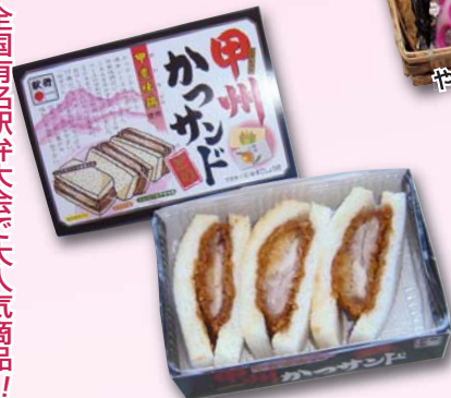
甲州かつサンド(鶏)……580円