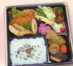
205 ポリューム弁当……945円