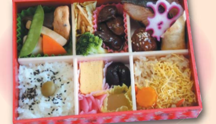
209 幕の内弁当 (6マス)……840円