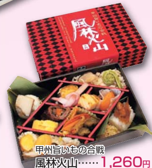
甲州旨いもの合戦 風林火山……1,260円