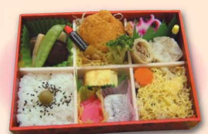
206 幕の内弁当 (6マス)……945円