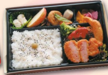
211 幕の内弁当 (肉中心)……735円