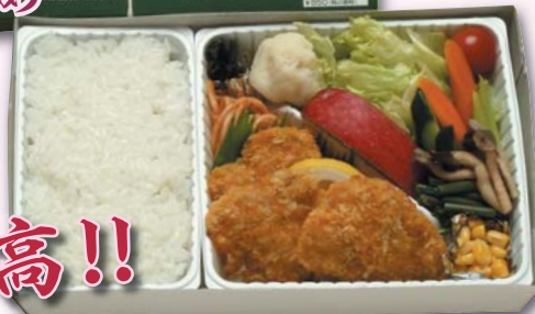
高原野菜とカツの弁当……850円