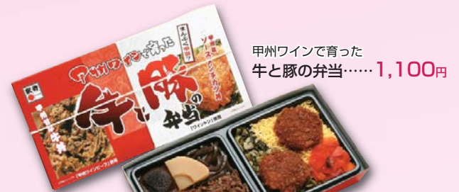
甲州ワインで育った 牛と豚の弁当……1,100円