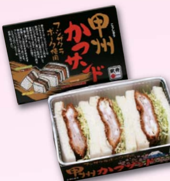
甲州かつサンド(豚)……600円