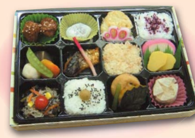
202 幕の内弁当 (12マス)……1,050円