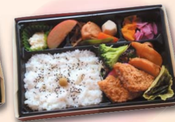
212 幕の内弁当 (魚中心)……735円